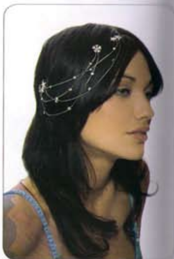
D'Ana Création - Sheherazade d'un jour avec ces doubles fils cristal qui se clipent aux cheveux en une multitude de possibilités...