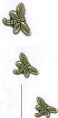
Lucyf'Hair - Des libellules pour agrémenter une coiffure de mariage tout en fraîcheur. Et à enfiler sur les cheveux comme des perles...