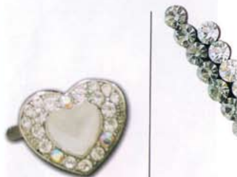
Camaflex - Barrette cœur en strass et nacre avec fermoir aimanté pour signer avec éclat une coiffure sophistiquée.